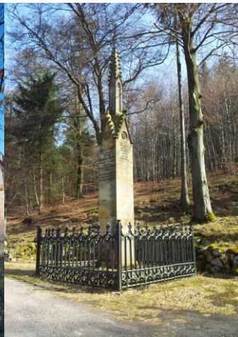
Luthers Entführungsort Glasbachgrund