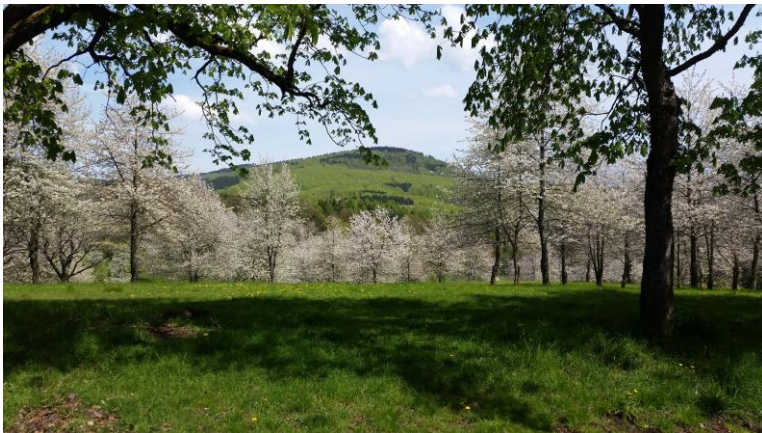
Das Ziel des Marathons am Fuße des Windsberg (671 üNN) mit Schloss & Park Altenstein schmückt sich bereits im Frühjahr in voller Blütenpracht