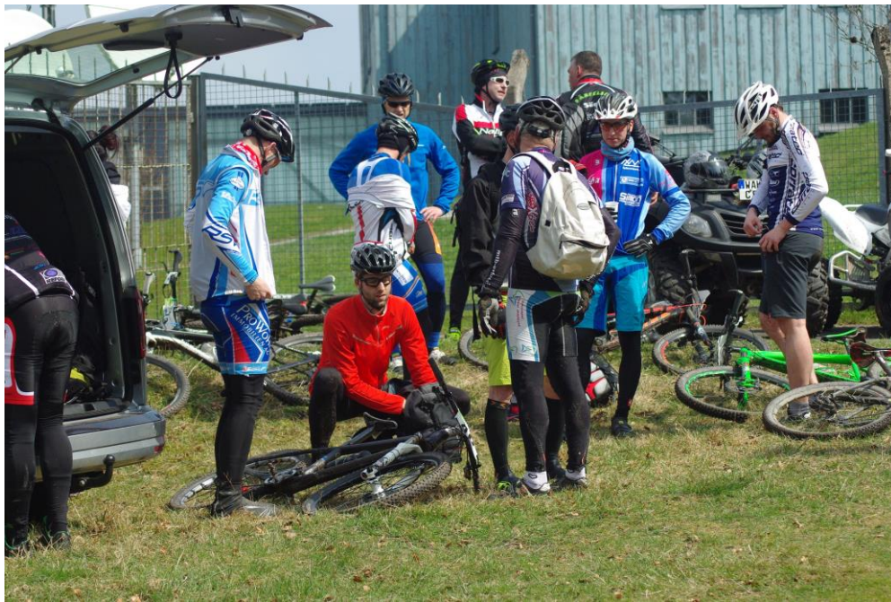
Das Ziel am Fuße des InselfbergTower (1036 üNN)