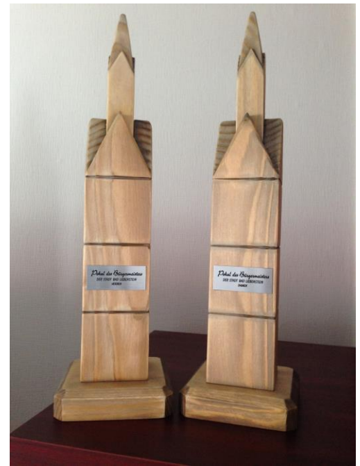
Luther-Pokal der Stadt Bad Liebenstein